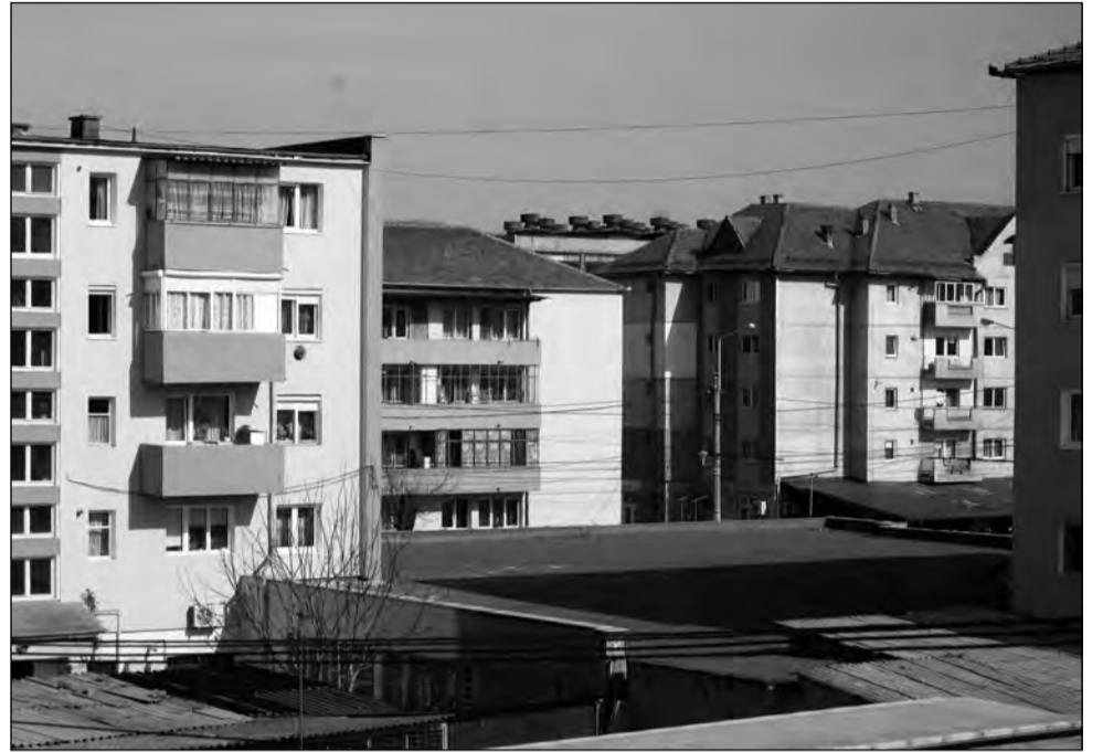
Cu asigurarea minimă, proprietarii pot primi despăgubiri de până la 20.000 de euro

10.000 de euro în cazul celor de tip B, construite din cărămidă nearsă, ori alte materiale neconvenționale. Polița standard minimă numită PAD (Polița de Asigurare împotriva Dezastrelor) este emisă de Popol-ul de Asigurare împotriva Dezastrelor Naturale și are preț fix: 20 de euro pe an pentru locuințele de tip A, respectiv 10 euro pentru cele de tip B. Perioada de valabilitate a poliței de asigurare obligatorie este