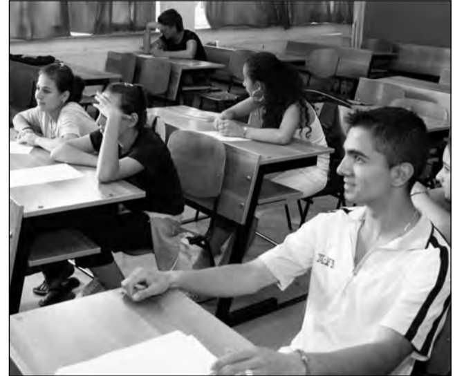
Elevii nu s-au așteptat la un examen atât de riguros