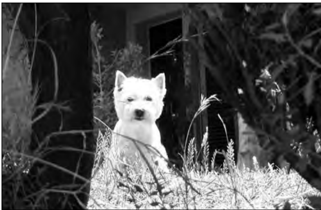
Un animal de casă te poate ajuta să rămâi mai tânăr cu un an

Un program de somn bun, același în fiecare noapte, te poa-