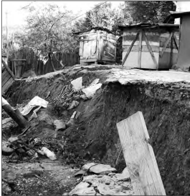
Alunecarea de teren măsoară aproximativ 50 de metri

În prezent, primăria le pune la dispoziția sinistratilor un adăpost de noapte în cadrul internatului Grupului Școlar „Nicolae Teclu”, urmând ca în două săptămâni să amenajeze la etajul al doilea al clădirii numărul de camere care să-i poa-