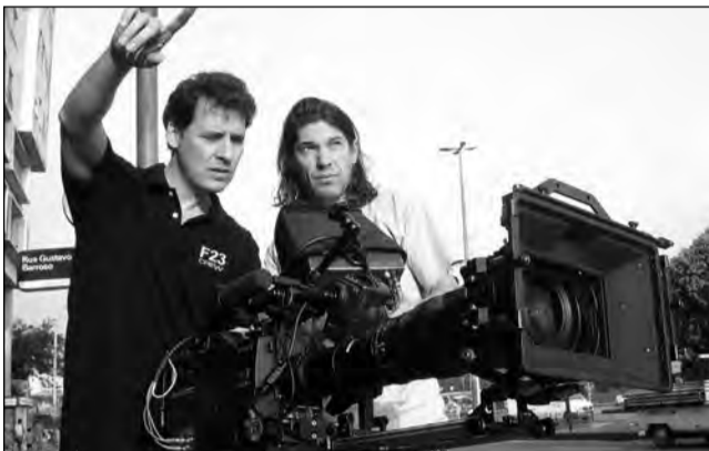
Organizatorii speră să reunească producții cinematografice din șapte țări

Evenimentul va avea loc în perioada 5-10 septembrie, când regizori, actori, atașați culturali din cele șapte țări concurențe vor veni în orașul nostru pentru a-și susține cele mai bune producții recente. Nu mai puțin de 50 de pelicule vor rula în diferite locații din Mediaș, iar selecția acestora se va desfășura în curând. „Cele mai bune filme din aceste țări vor concura pentru marele premiu al festivalului. În afara acestor filme care au fost premiate în țările lor vor mai putea fi vizionate și alte producții ale cinematografiilor din fiecare stat participant. Urmează a fi selecționate pentru festival