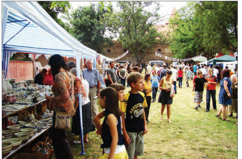
Organizatorii se așteaptă la o participare numeroasă și anul acesta

Primarul Mediașului, Teodor Neamțu, consideră că programul consistent al celei de-a șaptea ediții a festivalului medieval va reuși să se ridice la înălțimea așteptărilor publicului, care în mod cert are de unde alege. Mai mult decât atât, Neamțu este de părere că festivalul este în creștere de la an la an, fapt care nu poate fi decât un lucru bun pentru Mediaș. „Este o onoare și o bucurie în același timp să putem anunța că Primăria Mediaș, prin Direcția pentru Cultură, Sport, Turism și Tineret, organizează cea de-a șaptea ediție a fes-